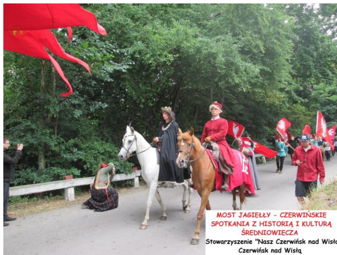
MOST JAGIELŁY - CZERWIŃSKIE SPOTKANIA Z HISTORIĄ I KULTURĄ ŚREDNIOWIECZA Stowarzyszenie "Nasz Czerwiński nad Wisłą" Czerwiński nad Wisłą