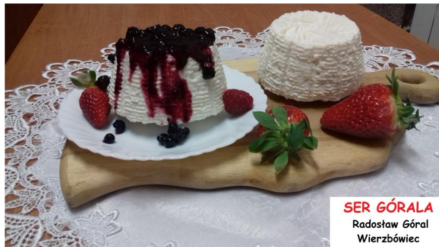
SER GÓRALA Radosław Góral Wierzbówiec