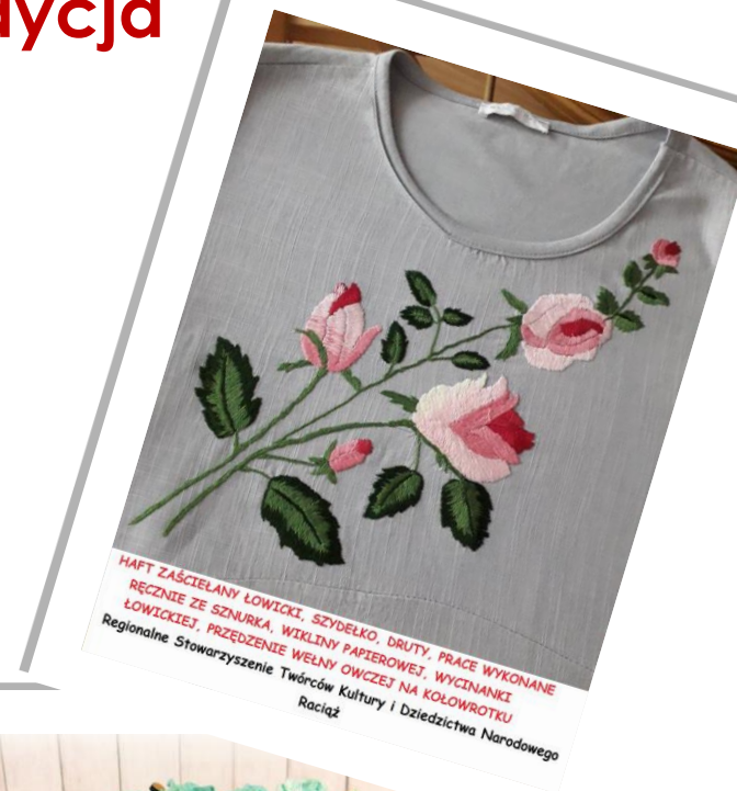
HAFT ZAŚCIELANY ŁOWICKI, SZYDELKO, DRUTY, PRACE WYKONANE RĘCZNIE ZE SZENURKA, WIKLINY PAPIEROWEJ, WYCINANKI ŁOWICKIEJ, PRZEDZIENIE WELNY OWCZEJ NA KOŁOWROTKU Regionalne Stowarzyszenie Twórców Kultury i Dziedzictwa Narodowego Raciąż